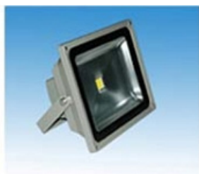
TL09 (LED Flut-Licht)